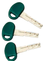
Chiavi uso abitazione

Ogni chiave oltre ad aprire il proprio cilindro (ma non gli altri cilindri dello stesso sistema) apre anche la serratura centrale. Tutte le chiavi di questa configurazione sono considerate chiavi maestre.